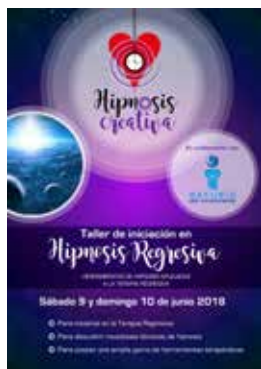
📍 HIPNOSIS CREATIVA