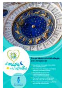
📍 EL MAPA DE LAS ESTRELLAS