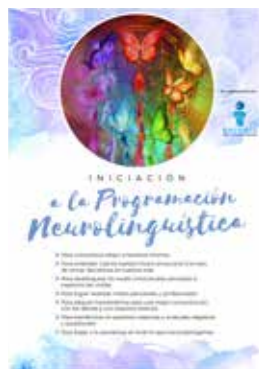
📍 INICIACIÓN A LA PROGRAMACIÓN NEUROLINGÜÍSTICA